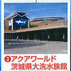
③アクアワールド 茨城県大洗水族館