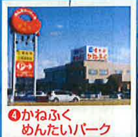
④かねぶくめんたいパーク