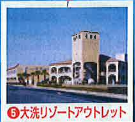
⑤大洗リゾートアウトレット