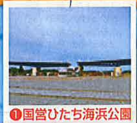
①国営ひたち海浜公園